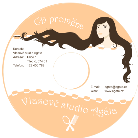
Ukázka, jak může CD Proměna vypadat

Blíží se sezóna společenských událostí. Vaši klienti touží po změně image, chtějí být krásní a okouzlující.